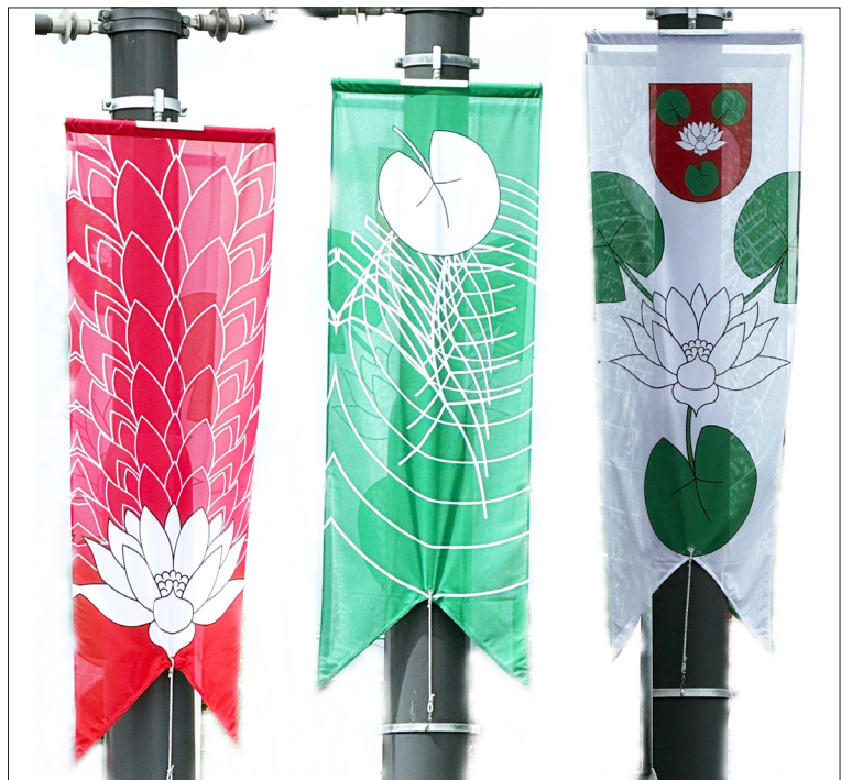
IDEE & GRAFIK: 3 FAHNEN FÜR GEMEINDE EBikon